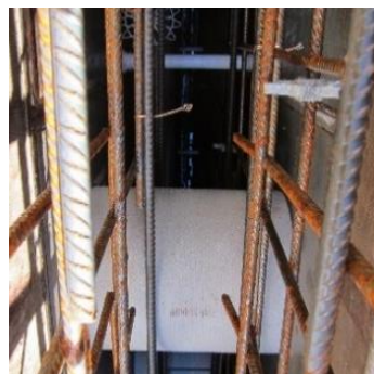
Installerad i formsättning