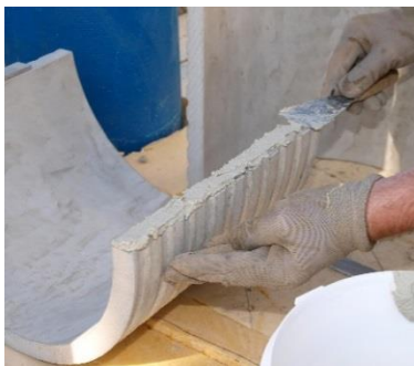
FZRG350/300 med installationssats MSET FZRG

För mer information om foderrör FZRG kontakta Electro Trading ET AB.