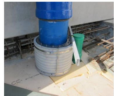
FZRG kan förses med slangklämmer för extra stöd