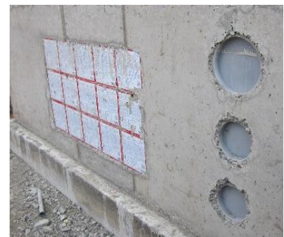
ZVR i betongvägg tillsammans med HSI 150