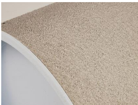
ZVR - ytbeläggning