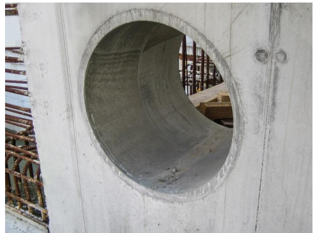
FZR – monterad i betongvägg