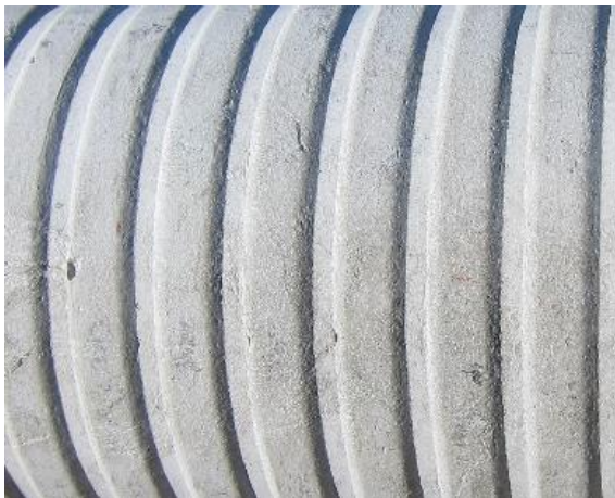
FZR - ytbeläggning